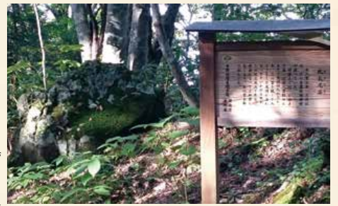
中社から奥社へ続く古道脇の比丘尼石