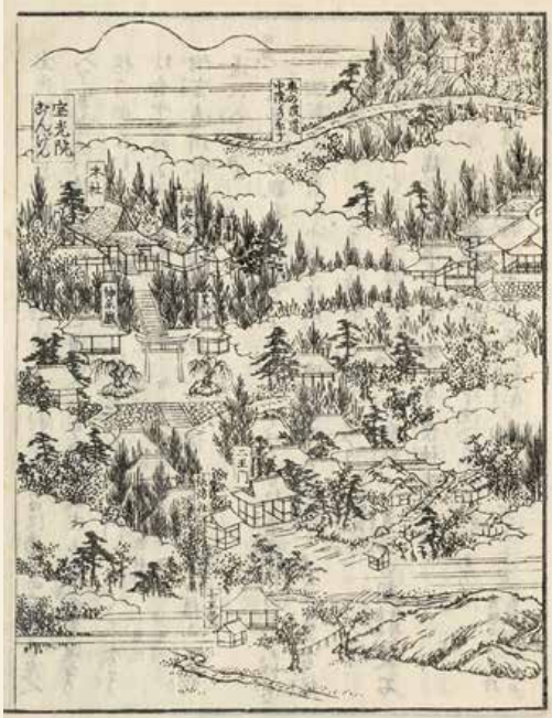
江戸時代の戸隠宝光院 (『善光寺道名所図会』より)

第二十回「俳句甲子園」の全国大会が開催された。これは、高校生が五人一チームで俳句の出来栄や鑑賞力を競いあうもので、過去最多の二十五都道府県から四十チームが出場したという。長野県からは、千曲市の屋代高校が初出場した。